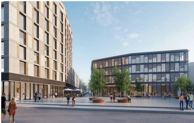
Copyright: Losinger Marazzi / Kaiser&Wittwer / Comamala Ismael / Voisard Architectes

Deux constructions modernes et élégantes remplacent le bâtiment postal actuel à Delémont. Situées au cœur de la ville, elles relient diverses zones de vie et de travail grâce à une conception réussie: autour de la place de la gare, d'importance stratégique, un espace de vie pour les jeunes et les moins jeunes voit le jour, de même que des locaux pouvant accueillir des entreprises, des start-ups, un hôtel, un restaurant, des bureaux ou encore des commerces. Ainsi la filiale postale Delémont 1 sera réintégrée dans le courant de l'automne 2022.